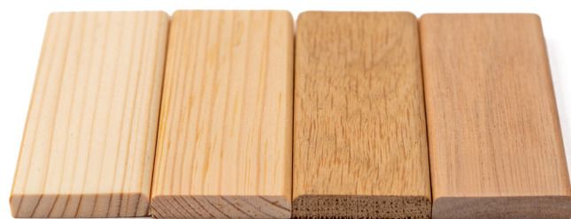
ŚWIERK SOSNA DĄB MERANTI